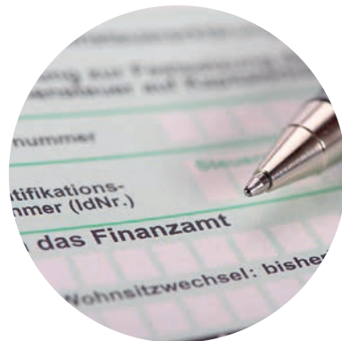
In der Einkommensteuererklärung zu 100 % als Sonderausgaben abzugsfähig 1