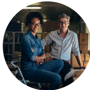
Steuererstattung – abhängig vom persönlichen Steuersatz