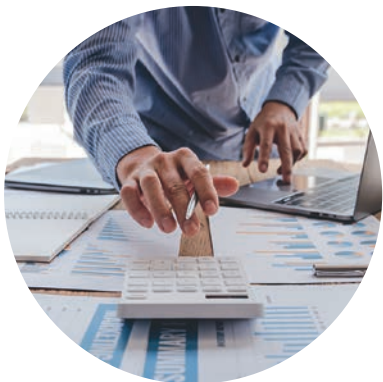
Laufende Beiträge zur BasisRente

Beiträge zur BasisRente können in der Einkommensteuererklärung als Sonderausgaben geltend gemacht werden. Dadurch reduziert sich die Einkommensteuerbelastung fürs veranlagte Jahr.