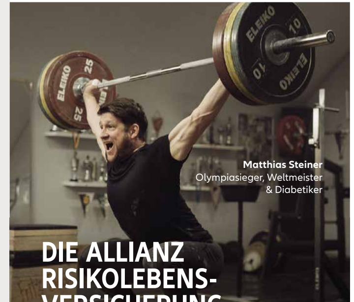
Matthias Steiner Olympiasieger, Weltmeister & Diabetiker